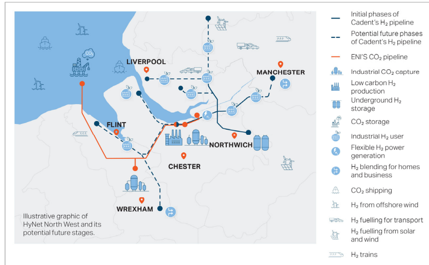
그림 2 Hynet의 개발계획