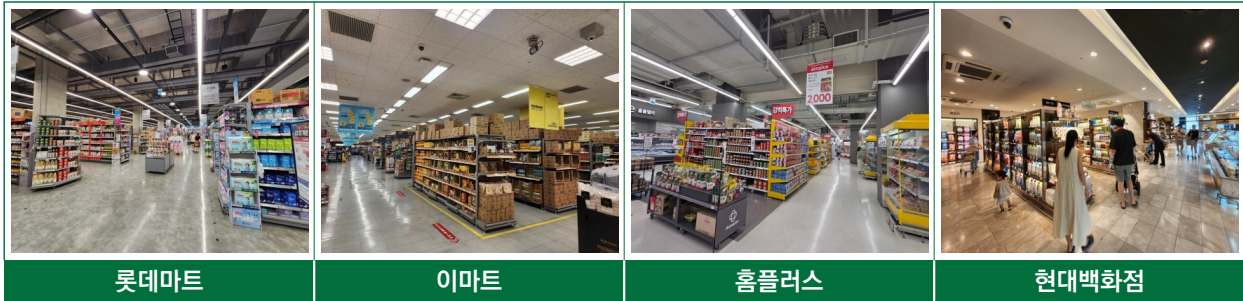
표 6 현장점검 대상업체 유형